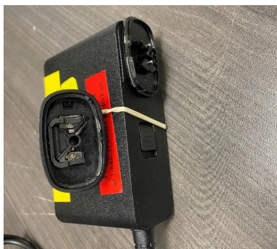
Figure 2: Skadad ingångskontakt