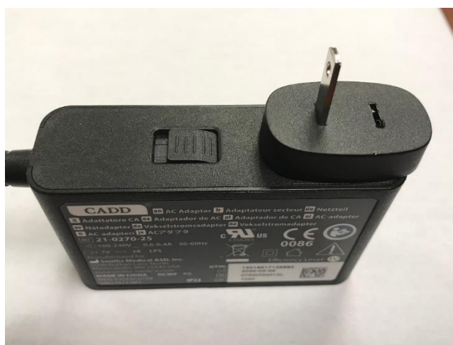
Figure 3: AC-adapter med saknad AC-uttag