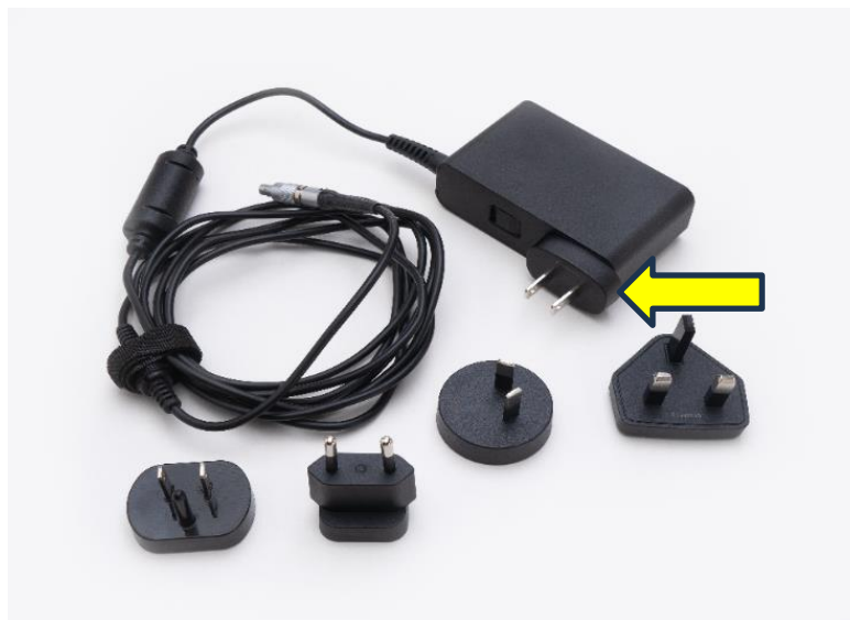
Figure 1: CADD- Solis AC Adapter

Nätadapterns ingångskontakt, markerad i figur 1 nedan, kan skadas eller gå sönder. Om ingångskontakten är skadad kan metallkontakterna till nätadapterns kropp exponeras eller så kan en eller flera av nätkontakten separeras från ingångskontakten.